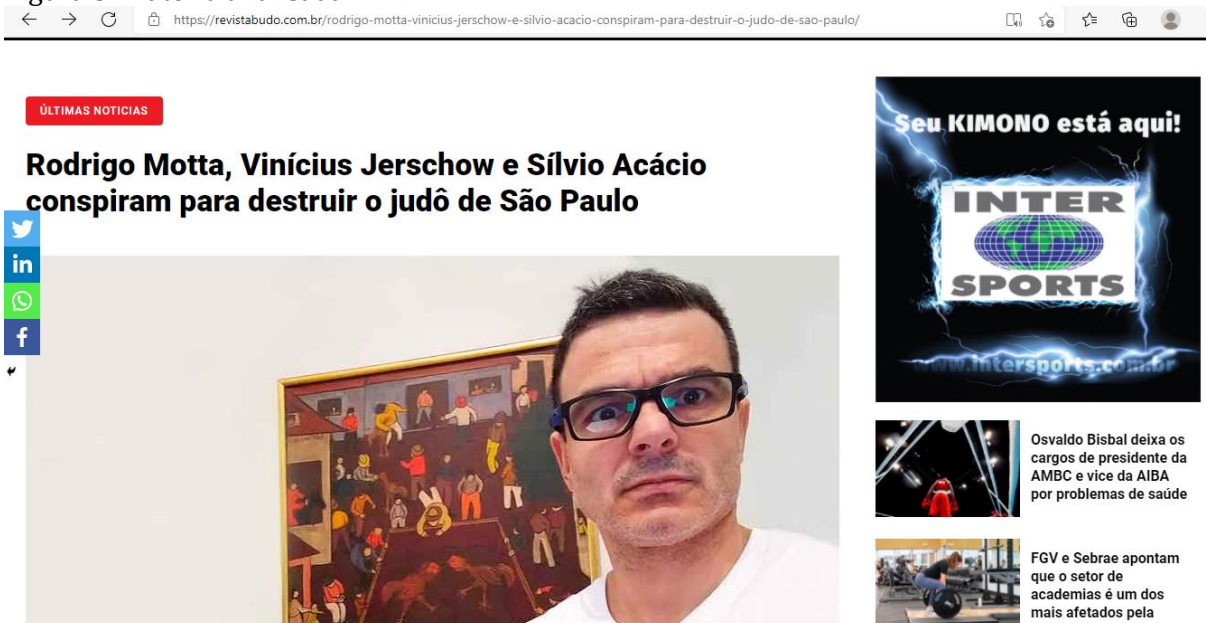
Figura 3: Matéria analisada.