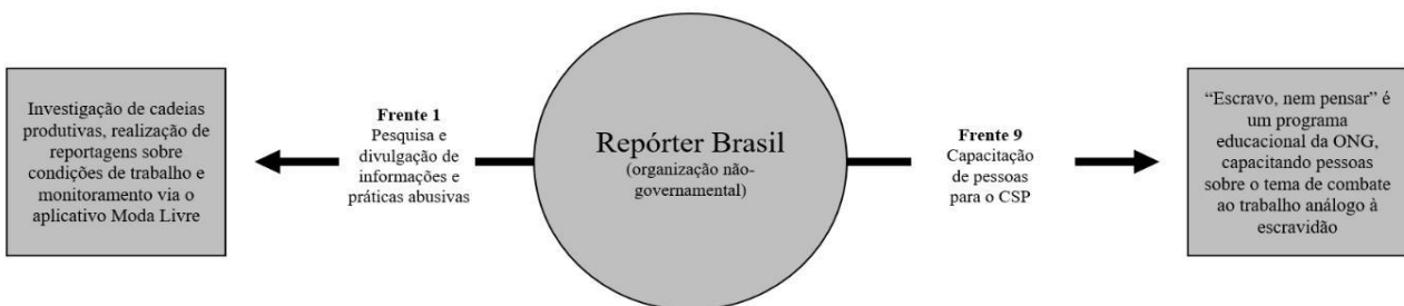
Figura 1: As Frentes do caso Repórter Brasil.

limitações de páginas, exemplificar como as organizações exercem o CSP. Na Figura 1, é possível ver que um dos casos estudados, a Repórter Brasil, atua em duas diferentes Frentes que constituem o CSP. Na Figura 2, o Greenpeace é uma organização sobre a qual se identificou a prática de cinco Frentes.